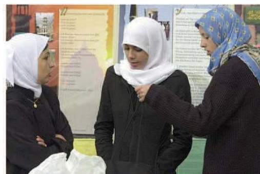
Opfer stammen oft aus dem islamischen Kulturkreis: Muslimische Frauen in Schwarzsee.

CVP- und SVP-Politiker fordern, dass eine Zwangsverheiratung ein zwingender Ausschaffungsgrund wird.