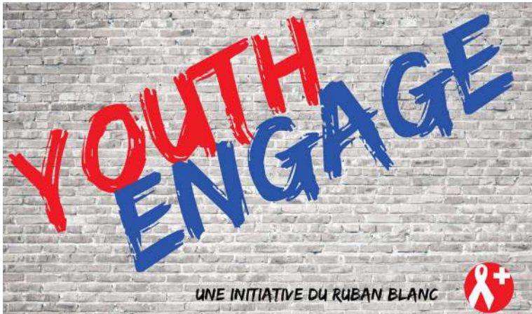
Lancement Déclaration Youth Engage - Ruban Blanc