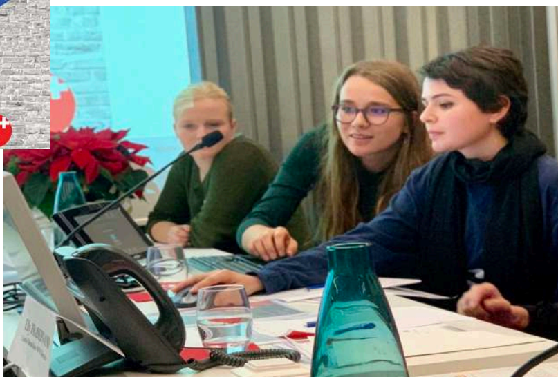
Comité d'action Youth Engage - Ruban Blanc