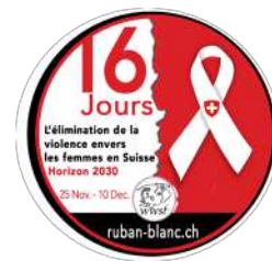
TABLE RONDE - RUBAN BLANC 2018