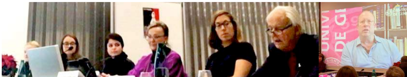
Orateurs-oratrices de la Table Ronde 2018